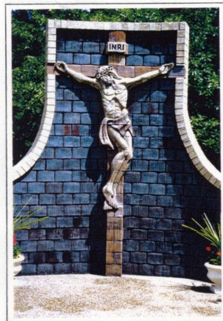
ST. JOSEPH'S HOME - STATION TWELVE