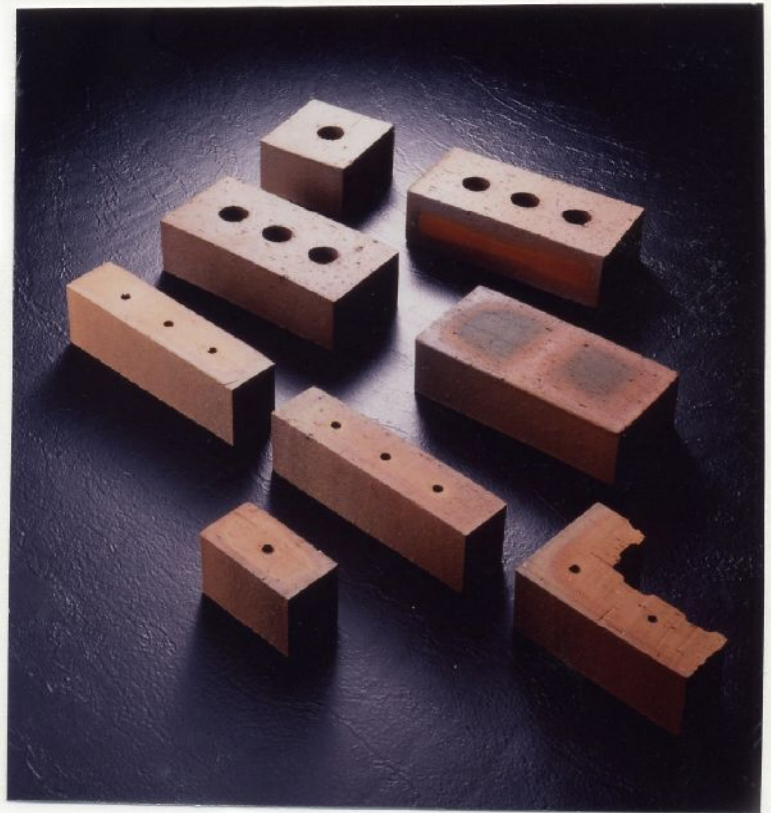
トンネルキルン アンダーファイヤー方式